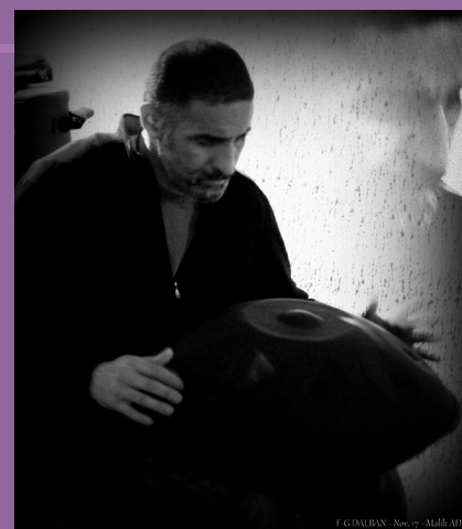
© F-G Dalban - nov.17 -Malik Adda