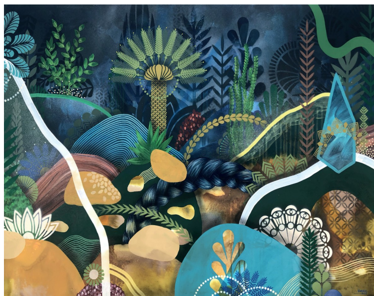
Acclimatation II - Acrylic, oil and ink on canvas, 100 x 73 cm | 2019

Dans ce projet, je joue avec les formes, les supports, les matières, et les couleurs : des petites montagnes, des grandes feuilles, des tissus tout doux ou rêches, des constructions fixes, d'autres transportables, des éléments mous, durs, brillants, mats ... afin d'éveiller les sens et la curiosité des enfants ! »