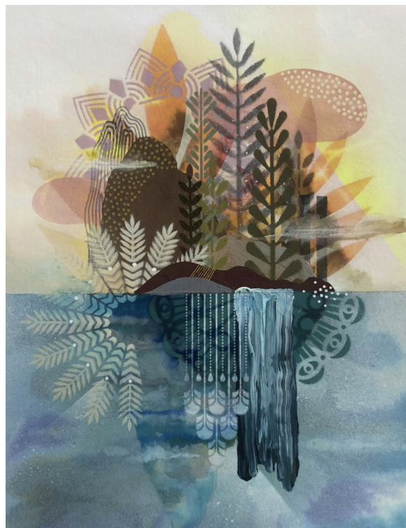
Jardin Flottant #4 - Mix media on paper - 36 x46 cm | 2019

« Le terme « Acclimatation » est littéralement l'adaptation de la nature à un nouvel environnement mais il peut être employé au sens métaphorique et personnel voir même collectif puisque c'est ce que nous expérimentons tous actuellement en cette période si particulière... Pour ce projet d'installation j'ai expérimenté une nouvelle façon de travailler. Mes peintures en 2 dimensions sortent de la toile pour devenir une œuvre en trois dimensions ».