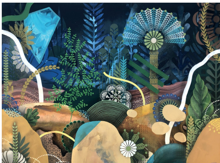
Acclimatation III - Acrylic, oil and ink on canvas, 100 x 73 cm | 2019

J'ai créé des palmiers inspirés par Michel Oslo et l'art déco, par la roue d'un paon ou des bijoux ethniques ».