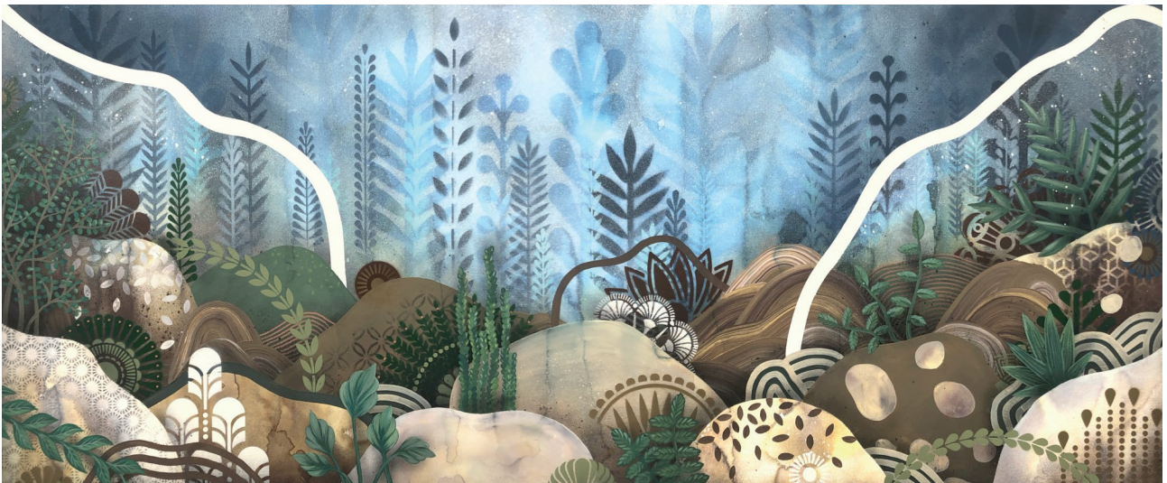
ACCLIMATATION / PAYSAGE 1 - Acrylic & Ink - 158 x 82 cm | 2020

« Comme dans un jardin, j'assemble, compose et harmonise le végétal et les éléments : le bleu du ciel et de l'eau, les textures de la terre, les ombres et la lumière, le relief des paysages. Au-delà de l'immense variété de formes des graines et des feuilles, je suis fascinée par la régularité, la symétrie et la répétition de leurs agencements. Il suffit que je regarde par la fenêtre de mon atelier pour contempler la beauté de la nature. Véritable invitation au voyage, mon jardin me souffle l'inspiration ».