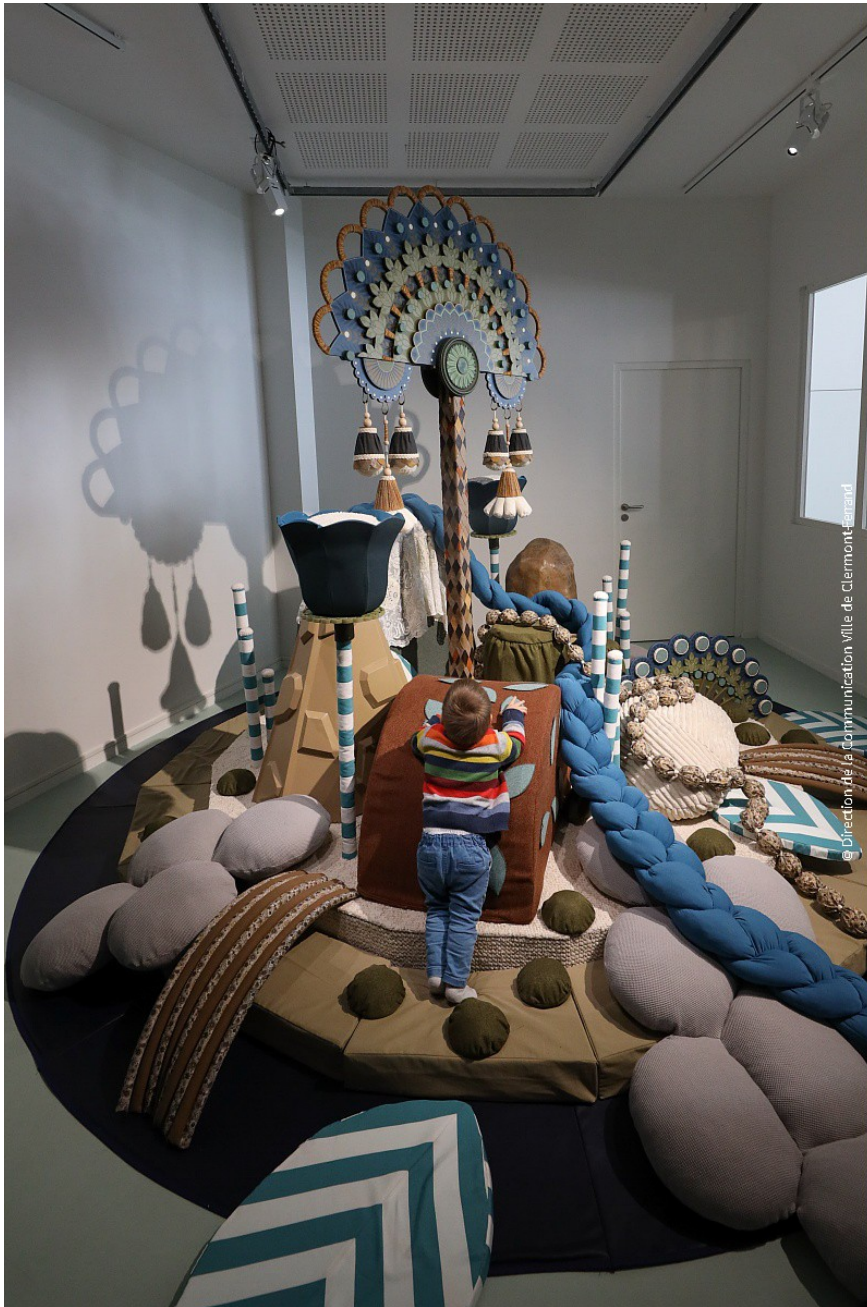
Vue de l'installation Jardin Flottant dans l'espace 0-24 mois de mille formes

Ce dispositif nécessite d'être installé sur un sol plat et neutre ou un lino blanc fourni par l'emprunteur.